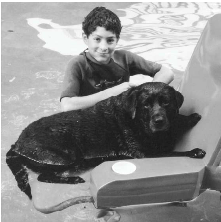
Midva z Ruby